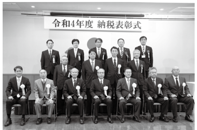
表彰された皆さん